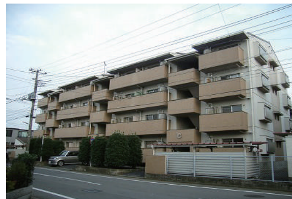
RC4階建て タイル張りマンション