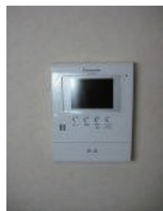
モニター付インターホン