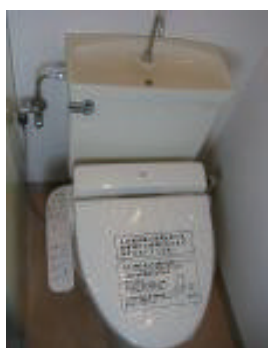
シャンプードレッサー ウォシュレット