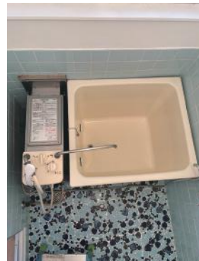
浴室 (窓、シャワー付)