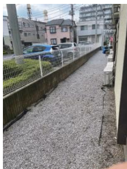
外スペース (1階のみ)

コモディイダ 8分 ドラッグエース 8分 セブンイレブン 9分 川越砂郵便局 7分 高階市民センター 9分