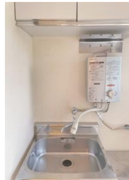
流し台・瞬間湯沸かし器