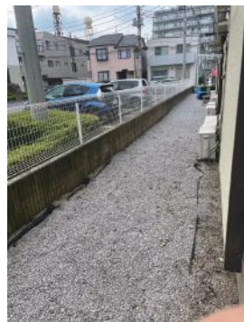
外スペース (1階のみ)

<必要書類> ・身分証明書・住民票 ・所得証明書 ・銀行印及び認め印 ※入れ墨、タトゥーのはいっている方は申し訳 ございませんがお断りさせていただきます。 ※フリーレントをご利用する場合、1年以内の解約は違約金1ヶ月分あり