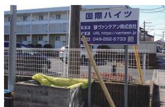
敷地内ごみ置き場