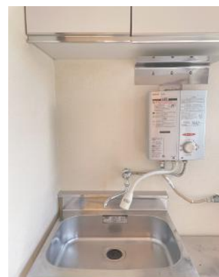
流し台・瞬間湯沸かし器