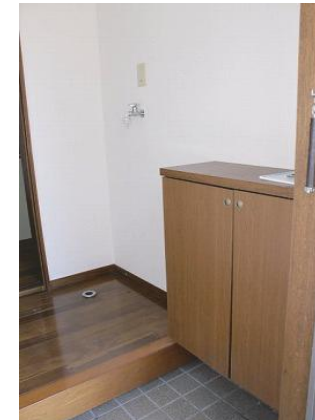
靴箱 / 洗濯機置き場