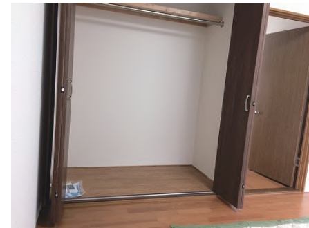
洋室 クローゼット