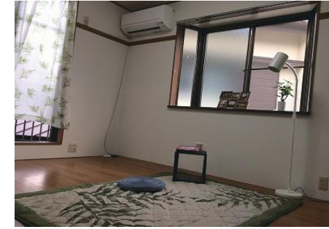
洋室（飾りは見本です）