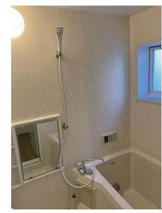
給湯 ユニットバス