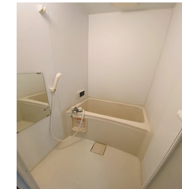
テレビ付ユニットバス