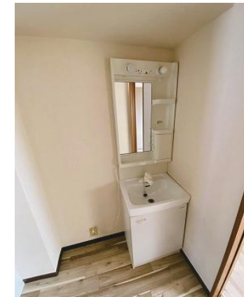
シャンプードレッサー