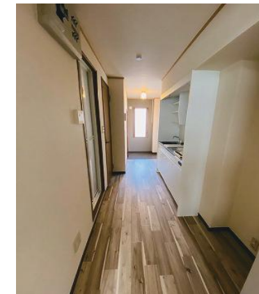
キッチンスペース