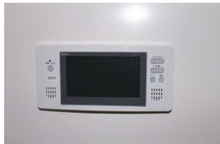
浴室専用テレビ付き