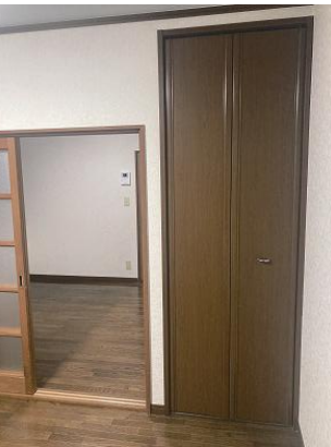
洋室クローゼット