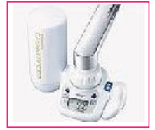
浄水器プレゼント (カートリッジ2年付き)