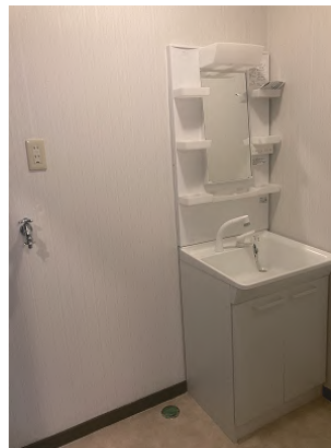
シャワー付洗面台