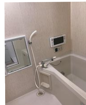
給湯 ユニットバス