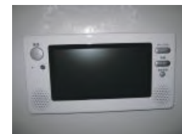
浴室には地デジテレビ付き