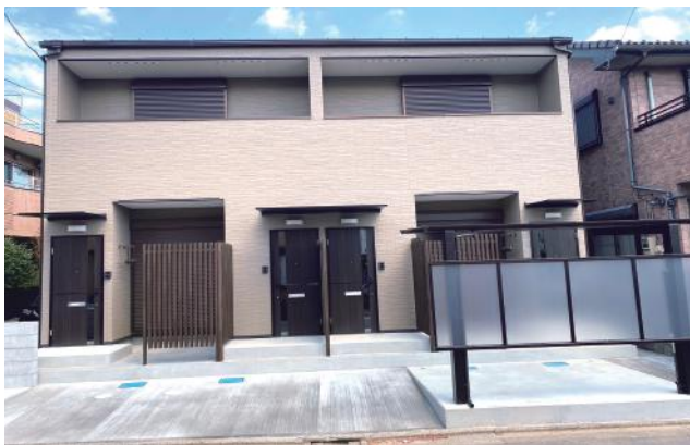
外観 (自転車・ゴミ置き場・防犯カメラ有り)