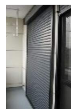
両戸 シャッター ゆったりとしたバルコニー