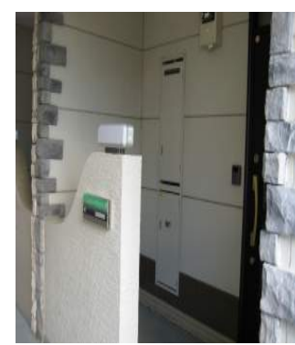
戸建て感覚の独立した玄関 各部屋 玄関・壁の様子が違います