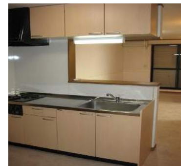
システムキッチン