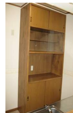
キッチン 備え付け 食器棚