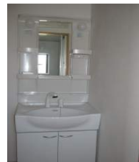
シャンプードレッサー