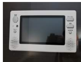
浴室 地デジテレビ付き

＜必要書類＞ ・身分証明書・住民票(世帯全員)・所得証明書 ・銀行印及び認め印 ※入れ墨、外ウーのはいている方は申し訳ございませんがお断りさせていただきます。