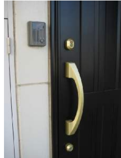
玄関 2重ロック モニターホン