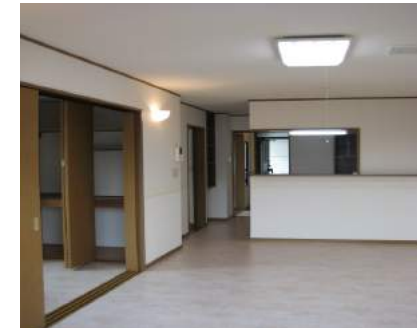
広々 LDK 窓には物干しに便利なフレクリーン有