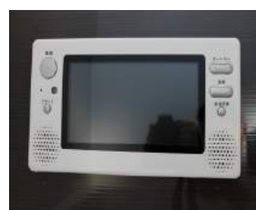
浴室 地デジテレビ付き