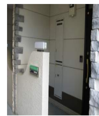
戸建て感覚の独立した玄関 各部屋 玄関・壁の様子が違います