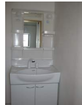
シャンプードレッサー