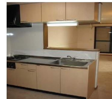
システムキッチン