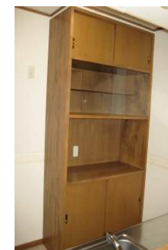
キッチン 備え付け 食器棚