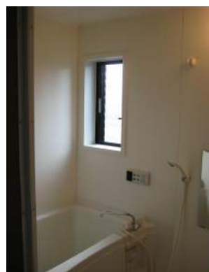
ユニットバス 給湯・追い焚き