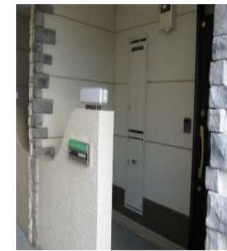
戸建て感覚の独立した玄関 各部屋 玄関・壁の様子が違います