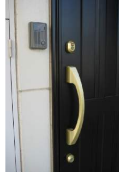
玄関 2重ロック モニターホン