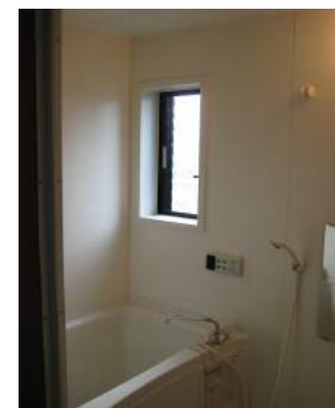
ユニットバス 給湯・追い焚き