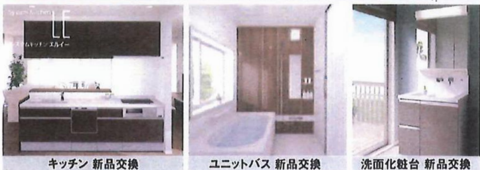
キッチン 新品交換