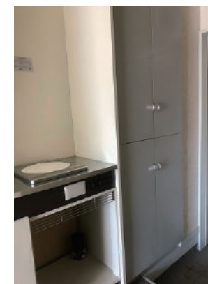
シューズボックス