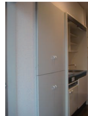
IHクッキングヒーター