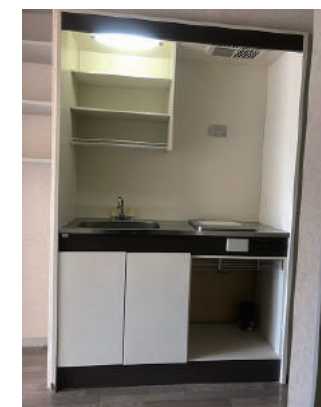
IHクッキングヒーター