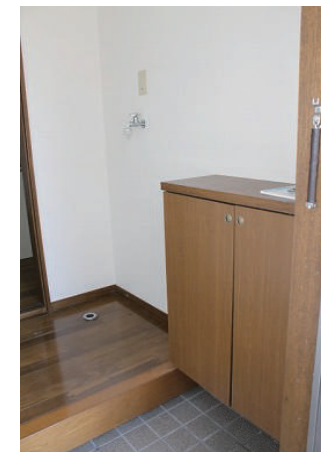
靴箱 / 洗濯機置き場