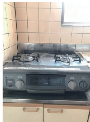
ガスコンロは新品です