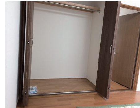
洋室 (フローリング、クローゼット、クロスとも新品です) (飾りは見本です)