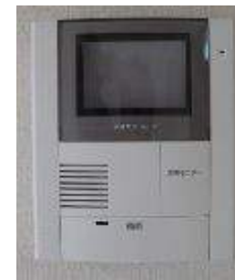
玄関 2重ロック TVモニターホン