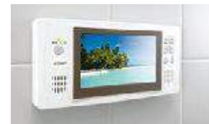
浴室専用テレビ付き