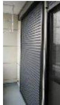
雨戸 シャッター ゆったりとしたバルコニー