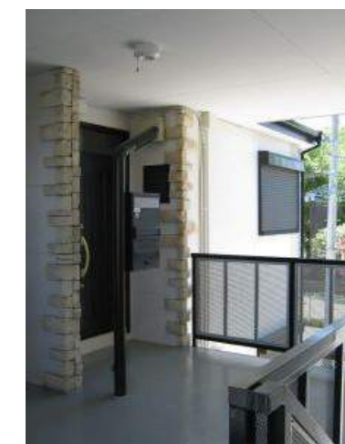
戸建て感覚の独立した玄関