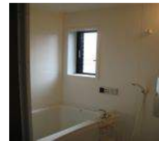
ユニットバス 追い焚き