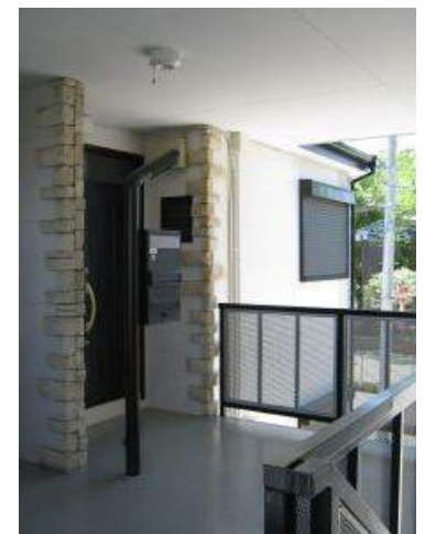
戸建て感覚の独立した玄関