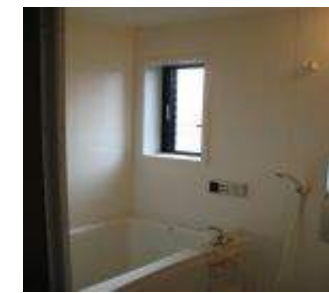
ユニットバス 追い炊き