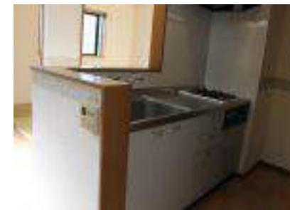
システムキッチン・カップボード 床下収納・人感ライト