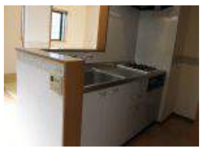
システムキッチン・カップボード 床下収納・人感ライト