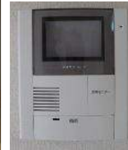
玄関 2重ロック TVモニターホン