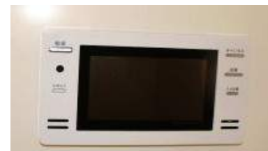
浴室専用テレビ付き