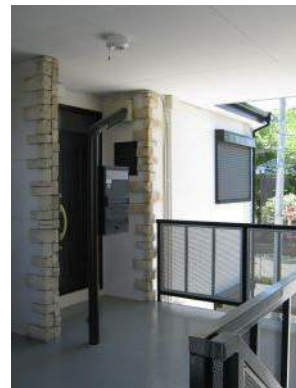
戸建て感覚の独立した玄関