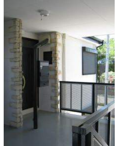
戸建て感覚の独立した玄関

<必要書類> ・身分証明書・住民票(世帯全員)・所得証明書 ・銀行印及び認め印 ※入れ墨、タトゥーのはいっている方は申し訳ございませんがお断りさせていただきます。