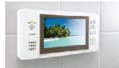
浴室専用テレビ付き