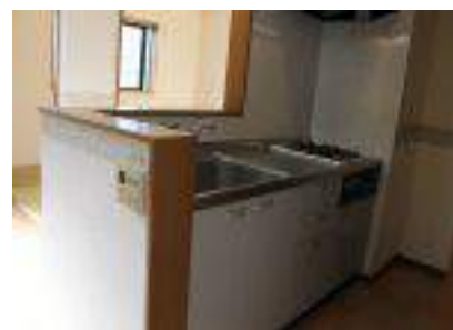
システムキッチン・カップボード 人感ライト