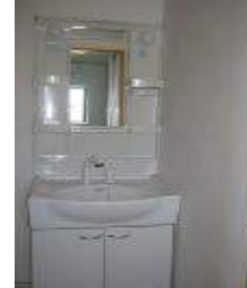
シャンプードレッサー