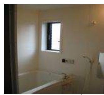
ユニットバス 追い焚き