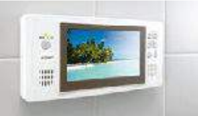
浴室専用テレビ付き