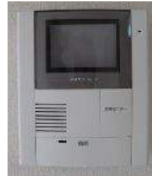
玄関 2重ロック TVモニターホン