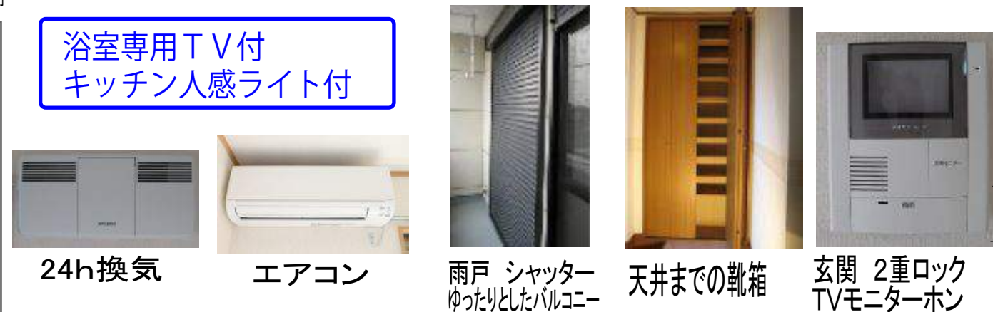
24h換気 エアコン 雨戸 シャッター ゆったりとしたバルコニー 天井までの靴箱 玄関 2重ロック TVモニターホン