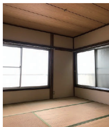
和室 全室、窓が2面あり 風通しが良いです