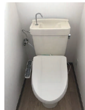
ウォシュレット 新品です