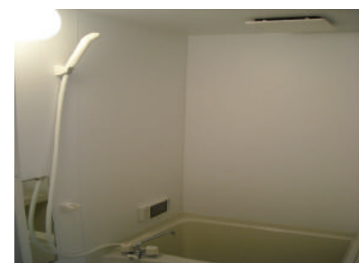
テレビ付ユニットバス