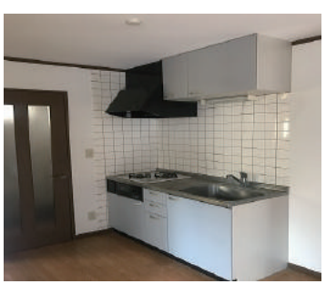
セミシステムキッチン 2つコンロ 給湯