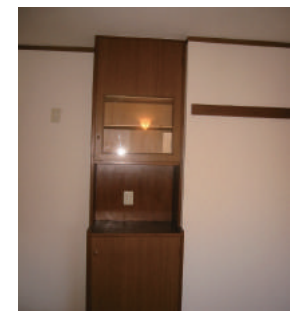
備え付け カップボード