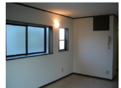
おしゃれな間接照明