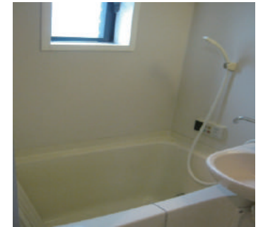
浴室シャワー・地デジ TV・追い炊き

<必要書類> ・身分証明書・住民票(世帯全員) ・所得証明書・銀行印及び認め印 ・学生証(学生の方のみ) ※入れ墨、タトゥーのはいっている方は申し訳ございませんがお断りさせていただきます。