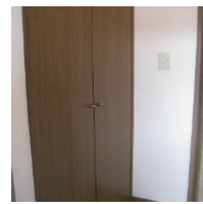
天井まであるシューズボックス