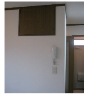
上部 物入れ インターホン