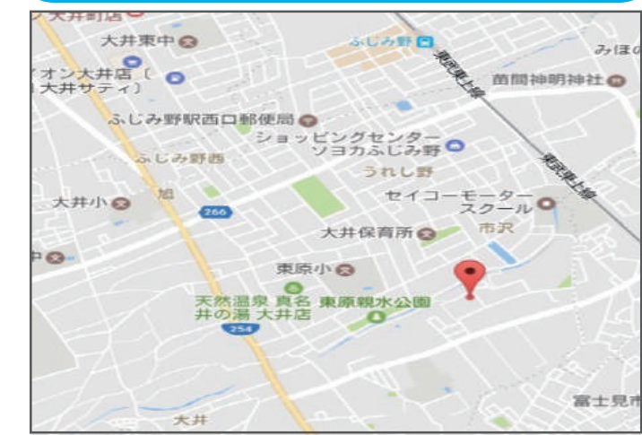
図面と現況が異なる場合は現況を優先させていただきます。