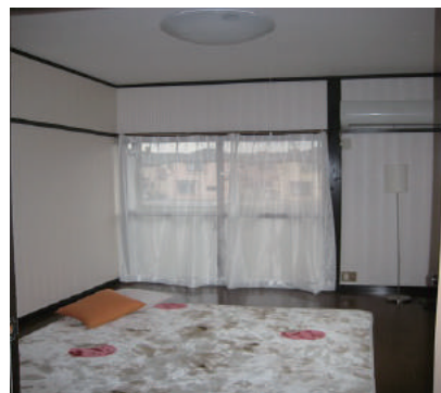
洋室(ラグ等はイメージです)