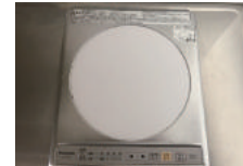
IHクッキングヒーター