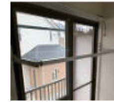
(窓に洗濯物が干せるフレ クリーン付きます)