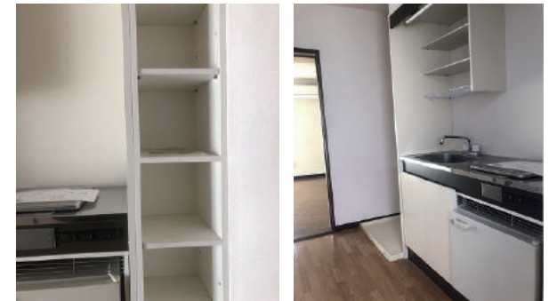
便利な棚付き IHクッキングヒーター キッチン